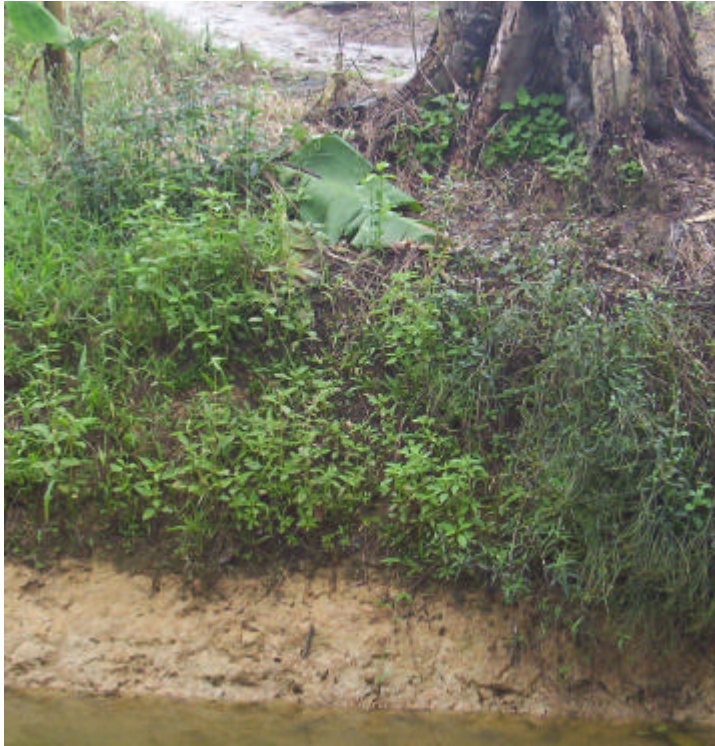
Foto 1. Suelo en un estanque para tilapia. Gareno, Territorio Huaorani. Provincia del Napo. Ecuador.

En relación con los suelos, Valencia et al. (2004) indican que la mayoría son sedimentos fluviales originarios de los Andes que datan del Mioceno. Taxonómicamente los suelos se clasifican como “ Udult ”, siendo arcillosos ricos en caolinita y en aluminio.